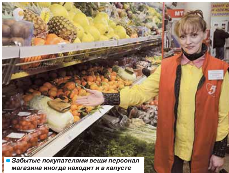
● Забытые покупателями вещи персонал магазина иногда находит и в капюше

«К сожалению, в нашем обществе еще существует стереотип, что работники торговли – не порядочные и вороватые люди. Поверьте, это далеко не так».